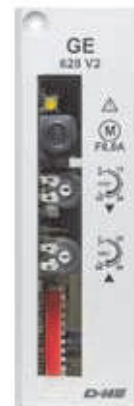
GE 628 V2