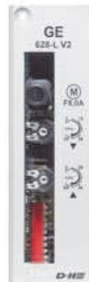
GE 628-L V2